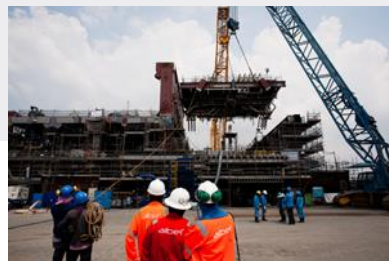
Verftet i Thailand