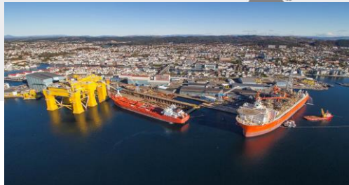
Verftet i Haugesund