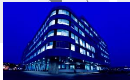
Hovedkontor i Stavanger