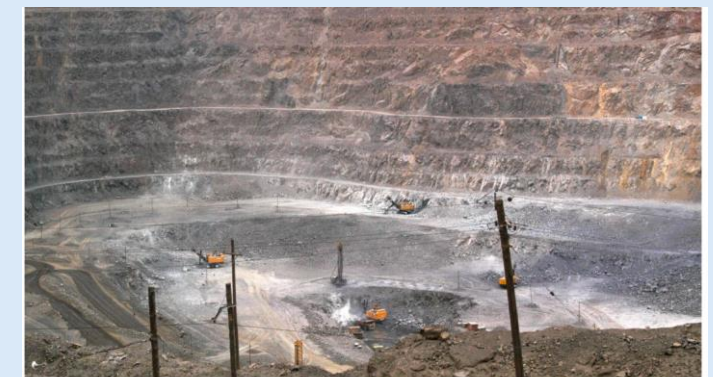
Kina har brukt de sjeldne jordartene i handelskrigen tidligere og blitt felt for det i Verdens handelsorganisasjon, WTO.