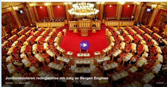
Justisministeren redogjør for salg av Bergen Engines

– Det er nødvendig å forhindre at Bergen Engines blir solgt til et selskap som kontrolleres av et land vi ikke har et sikkerhetssamarbeid med, sier justisminister Monica Mæland.