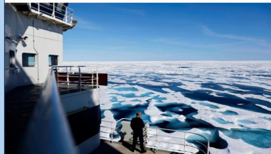
TV 2 PÅRIS: Den første iskrystallen MSV Nordica bryter seg ve gjennom isen i Arktis. I fremtiden kan en frisk penne gjøre det mulig for Norge å ta del i kinesisk vest langs den nordlige sjørute.

Kina vil lage en ny silkevei i Arktis. Norske byer kjemper om å bli et knutepunkt for all godstrafikken som forventes langs den nordlige sjørute.